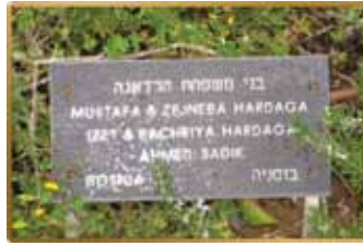
העץ שניטע בשם משפחת הרדגה ב"ד ושם"