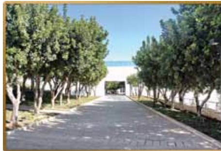
שדרת הסידי אומות העולם ב”יד ושם“, ירושלים

מוסד ”יד ושם“, הממוקם ביער ירושלים השליו, מנציח את זכרם של היהודים שנרצחו על ידי הנאצים בשואה. אתר זה משמש תזכורת נצה עבור העולם על חוסר האנושיות של אדם לאדם ומה עלול להתרחש כאשר מאפשרים לשנאה, צרות אופקים, ודעות קדומות לפרוץ בקרב חברות שהיו תרבותיות בעבר.